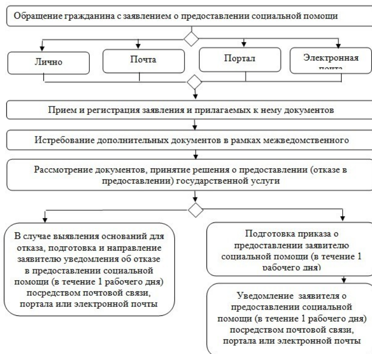
Рисунок 5 - Порядок назначения государственной социальной помощи 12

Сбор необходимых сведений о доходах не вызывает трудностей для граждан рассчитывающих на помощь со стороны государства потому, что своё бедственное положение люди всегда подтверждают необходимым набором документов, тем более ответственность возлагается не на самих граждан предоставляющих необходимые сведения, а на те организации, которые эти документы предоставляют. Это должно серьёзным образом урегулировать быстроту и самое главное достоверность необходимых сведений.