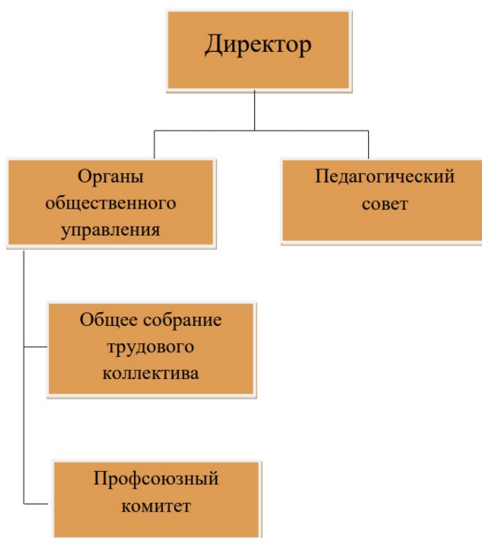
Рисунок 2 - Схема управления организацией 10

- формирование ресурсной карты в части индивидуальной профилактической и реабилитационной работы с семьями и несовершеннолетними, находящимися в социально опасном положении.